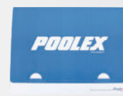
Wartungskit inklusive mehrsprachigem Benutzerhandbuch