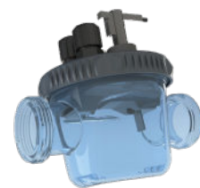
Messkammer Nur Phileo POD VP