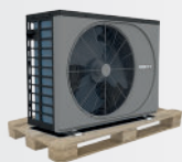
Livraison sur palette bois