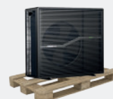
Livraison sur palette bois

Le + POOLEX : tous les accessoires inclus